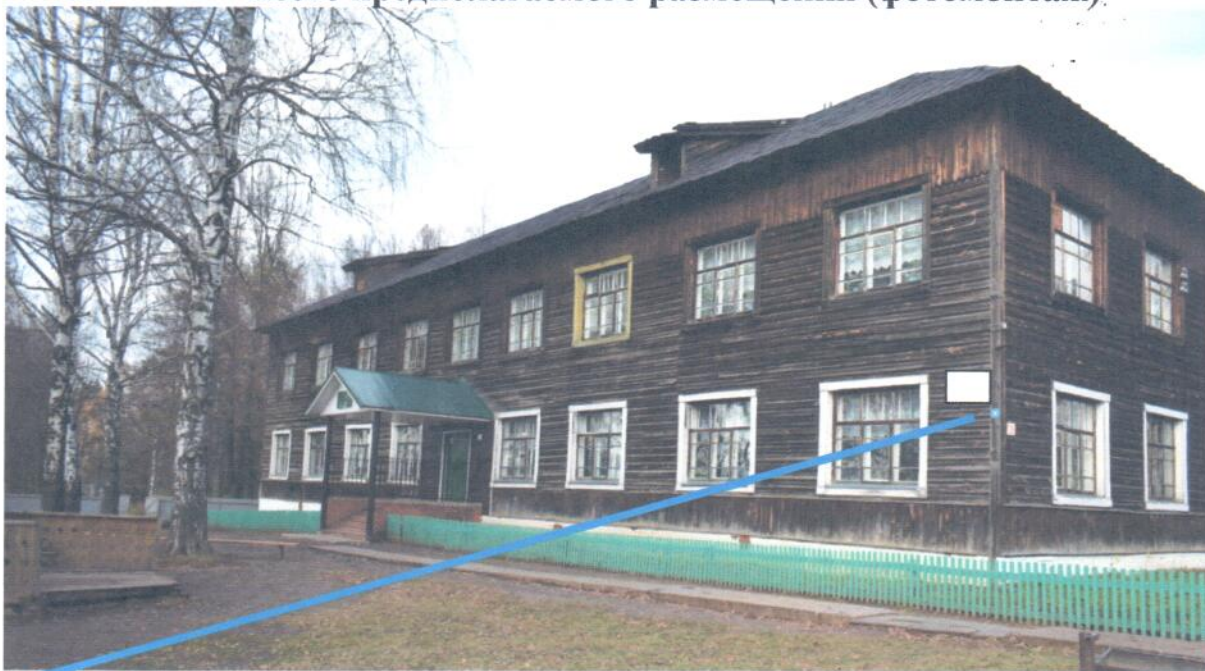
Фото фрагмента фасада с привязкой к месту установки информационной надписи.